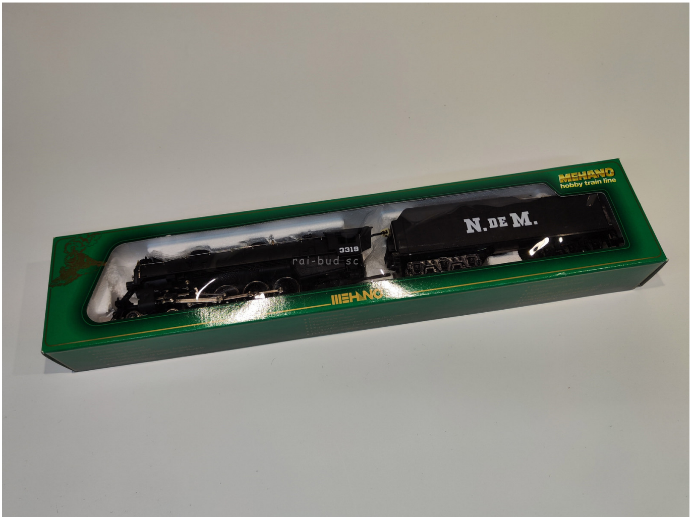
LOKOMOTYWA PAROWA 4-8-2 MOUNTAIN SKALA HO 1:87 DC