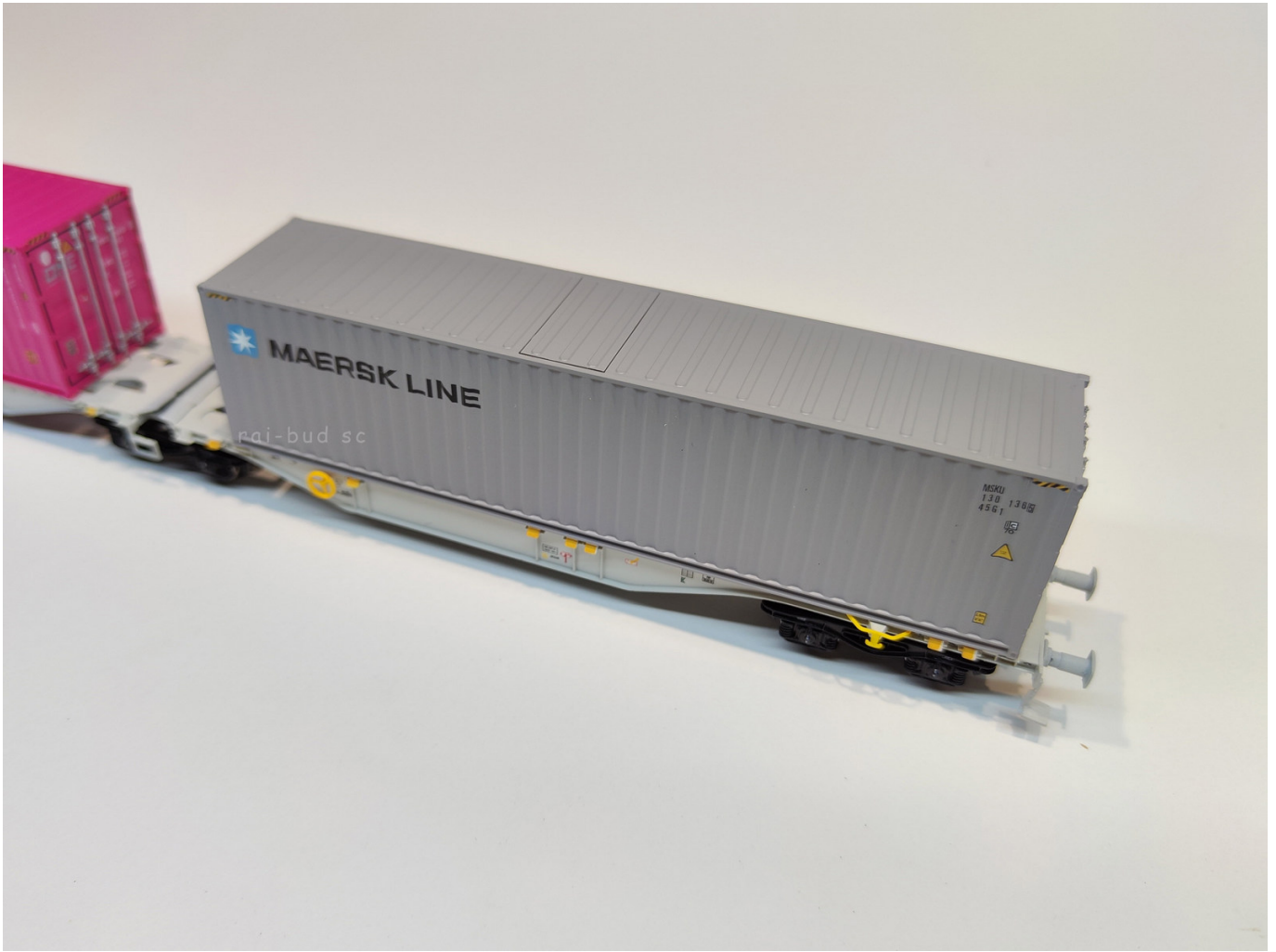
Model: laweta z kontenerem : WAGON LAWETA SGGMRSS ONE-MAERSK HO 1:87 WAGON TOWAROWY